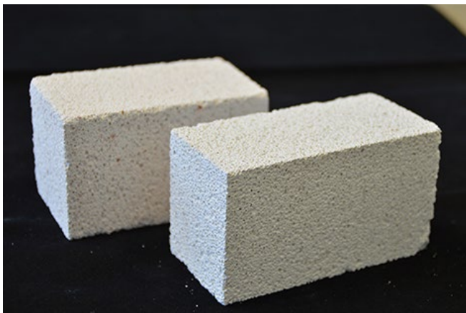
Der klimafreundliche Porenbeton punktet mit seinen hervorragenden Dämmeigenschaften, einer langen Lebensdauer sowie guten akustischen Eigenschaften.