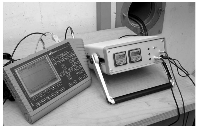
Bild 2: Schallanalysator mit Steuereinheit des Positioniersystems.