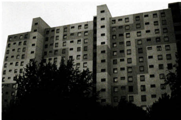
Bild 1: Zwölfgeschossiger Wohnblock bei Frankfurt mit nachträglich - vor 3 Jahren - aufgebrachtem mineralischen Wärmedämmverbundsystem mit unterschiedlicher Farbgebung des Oberputzes.

hängenden Putzflächen, als auch mit stark gegliederten Fassaden. Ein in dieser Hinsicht beispielhaftes Objekt ist in Bild 1 dargestellt.