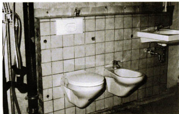
Bild 2: Untersuchung der Körperschall-Anregung durch Sanitär-Objekte bei einer Vorwand-Installation im Installations-Prüfstand des IBP

Die Hersteller von Armaturen, Geräten und Zubehör für Wasserinstallationen sollten sich besser nicht auf den jetzt formulierten neuen Anforderungen der DIN 4109 ausruhen. Da die Entwicklung geräuschärmerer Geräte erfahrungsgemäß viele Jahre in Anspruch nimmt, können sie auch unmöglich so lange warten, bis die neuen Meß- und Prüfverfahren nach einem sicherlich sehr langwierigen Abstimmungsprozeß in den zuständigen Gremien schließlich als Norm verabschiedet worden sind. Bereits heute arbeiten daher die Hersteller der oben genannten Produkte intensiv an ihrer Verbesserung, siehe z.B. Bild 2 und [3].